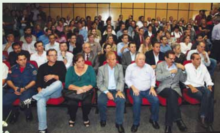
Prefeitos, secretário de Estado e representantes de entidades de toda a região estiveram em Itajaí para assinatura dos convênios do Programa Nova Economia@SC.

O programa Nova Economia@SC vai investir R$ 74.820.564,00, sendo do Governo do Estado: R$ 52.417.964,00 (70%) e SEBRAE/SC: R$ 22.402.600,00 (30%).