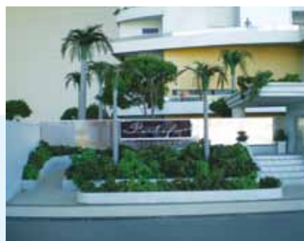
Entre as obras executadas pela empresa estão o Fazzenda Park Hotel, em Gaspar e a Marina Tedesco em Balneário Camboriú. A maior obra que está sendo construída em Brusque é o edifício Portofino, no Centro.