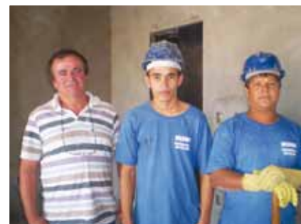
Profissionais da Brusnova visitam constantemente as obras para conversar com os trabalhadores.

mais empregos e valorizou a região e como Brusque é uma cidade que há muito espaço para crescer, e também muito espaço para novas obras, seja no setor residencial como em todos os outros setores econômicos”.